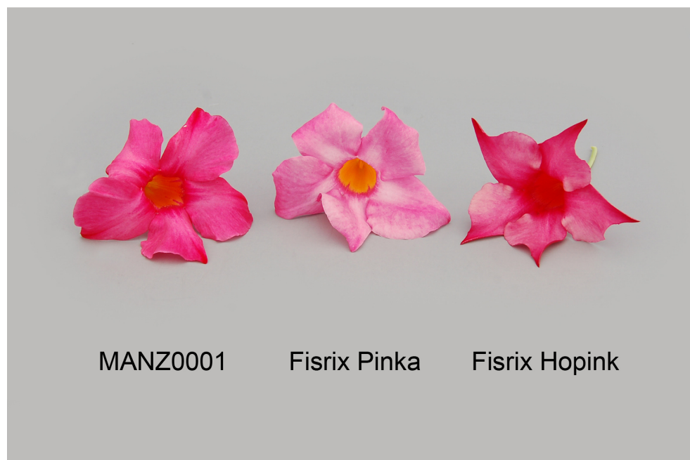
Mandevilla: 'MANZ0001' (gauche) avec les variétés de référence 'Fisix Pinka' (centre) et 'Fisix Hopink' (droite)