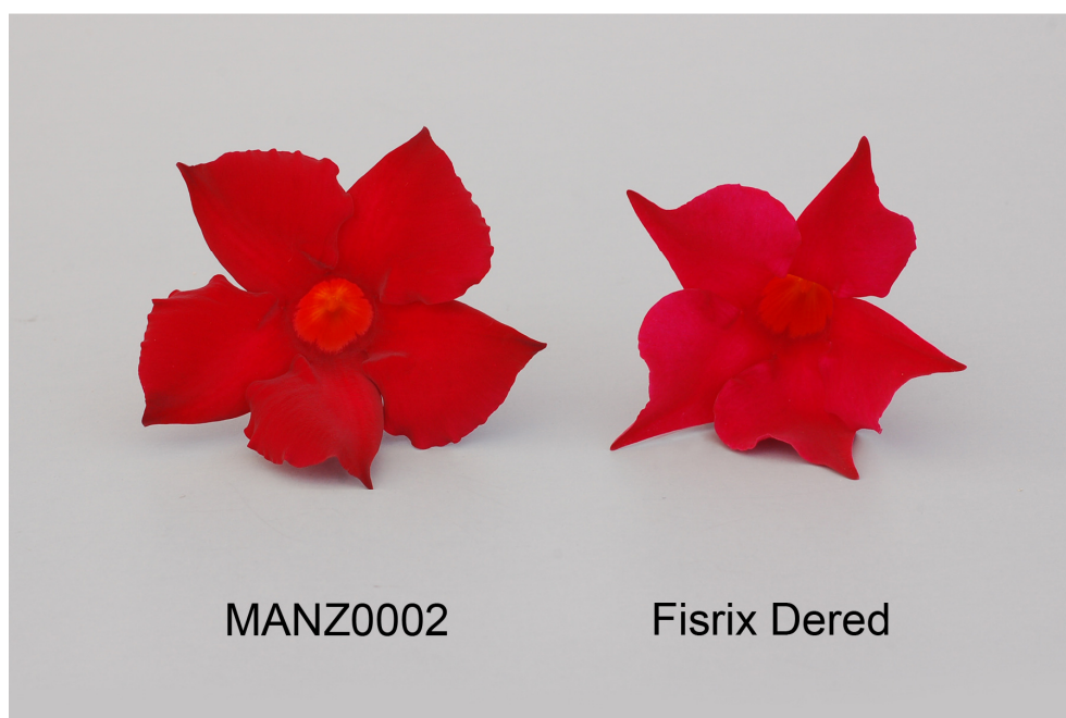
Mandevilla: 'MANZ0002' (gauche) avec la variété de référence 'Fisix Dered' (droite)