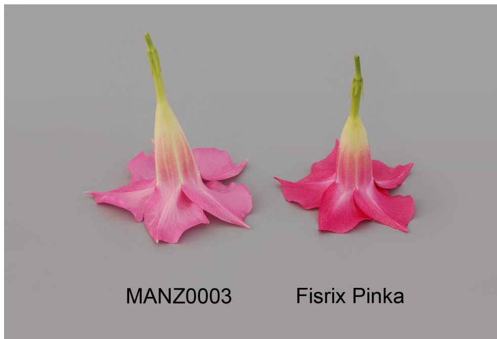
Mandevilla: 'MANZ0003' (gauche) avec la variété de référence 'Fisrix Pinka' (droite)