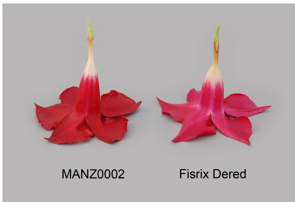
Mandevilla: 'MANZ0002' (gauche) avec la variété de référence 'Fisrix Dered' (droite)