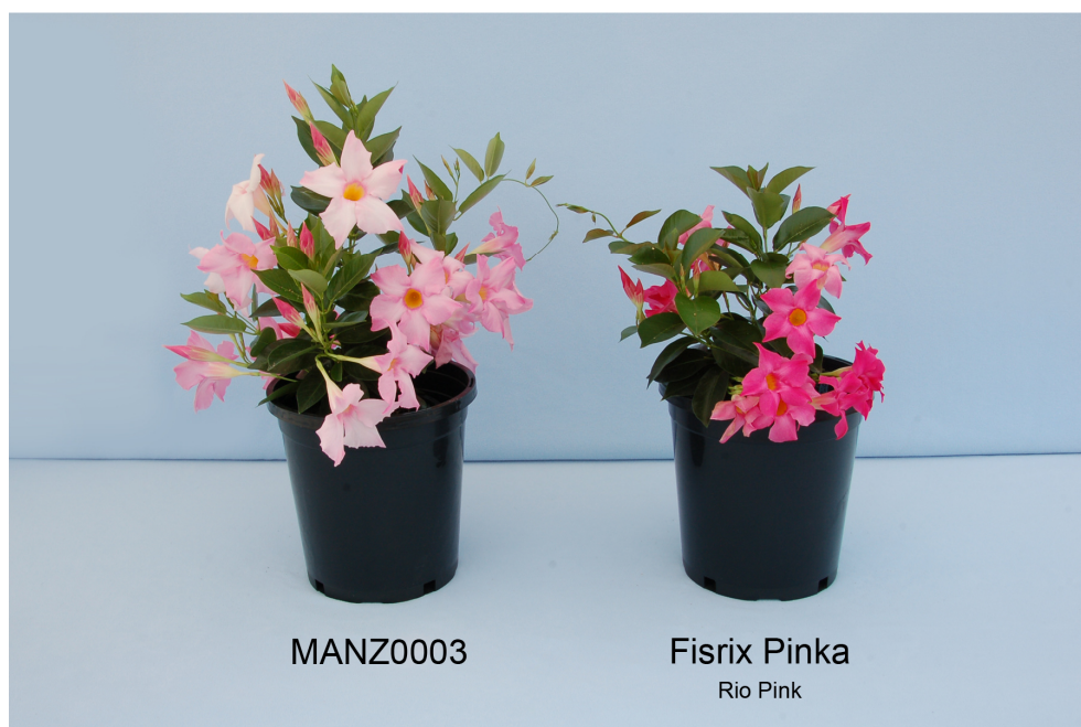
Mandevilla: 'MANZ0003' (gauche) avec la variété de référence 'Fisrix Pinka' (droite)