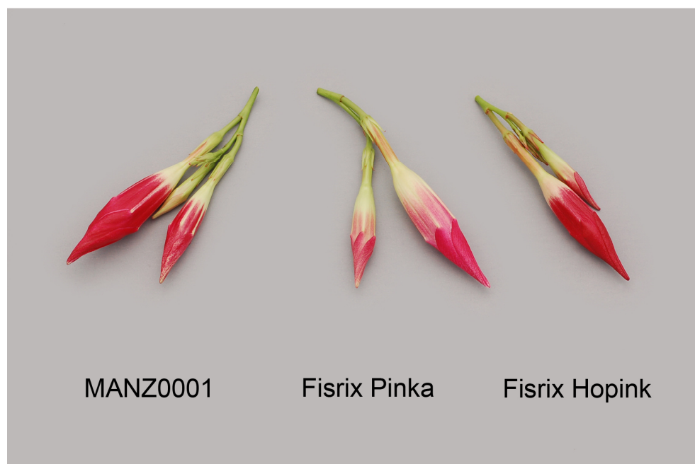
Mandevilla: 'MANZ0001' (gauche) avec les variétés de référence 'Fisix Pinka' (centre) et 'Fisix Hopink' (droite)