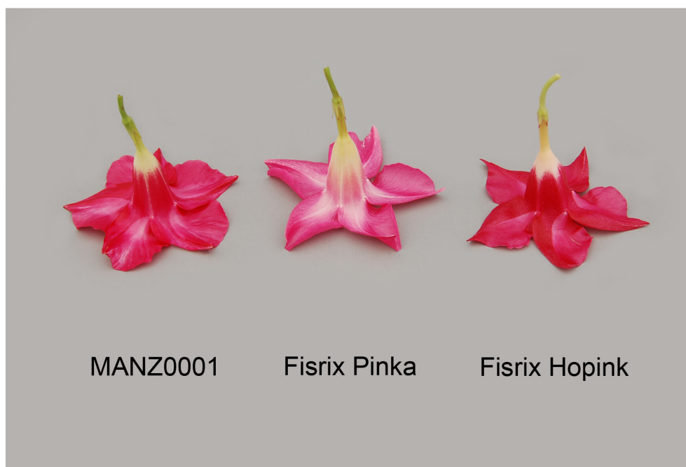
Mandevilla: 'MANZ0001' (gauche) avec les variétés de référence 'Fisrix Pinka' (centre) et 'Fisrix Hopink' (droite)