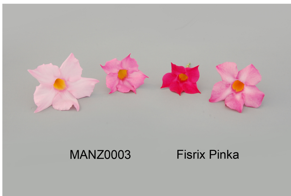
Mandevilla: 'MANZ0003' (gauche) avec la variété de référence 'Fisrix Pinka' (droite)