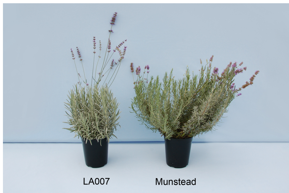
Lavande: 'LA007' (gauche) avec la variété de référence 'Munstead' (droite)