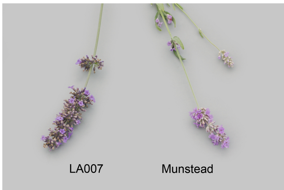
Lavande: 'LA007' (gauche) avec la variété de référence 'Munstead' (droite)