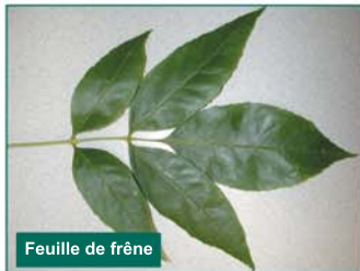
Feuille de frêne