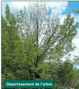
Dépérissement de l'arbre