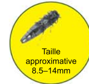
Taille approximative 8.5-14mm